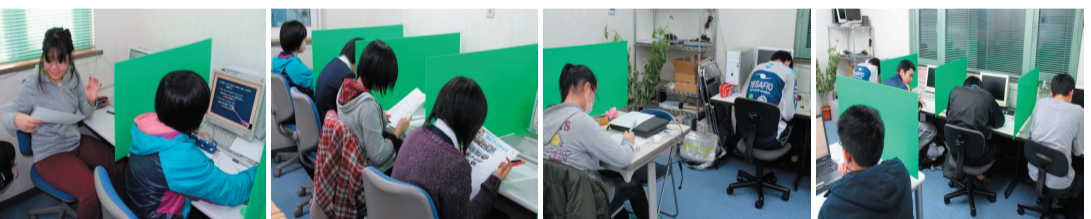
昨年の終わりに隣との間を仕切りました。生徒には、集中して勉強できると好評でしたので全てに設置しました。

「4月、入試は終わりましたが新しい気持ちで！」 今年の、入試の結果、高校は湖陵高校理数科1名、普通科3名、江南高校3名、鉦路高専7名、北陽高校1名、明輝高校2名、東高校1名、工業高校1名、商業高校2名、白糠高校1名、札幌文教高校1名、旭川実業高校1名、室蘭大谷高校1名。中学校は札幌聖心女子中学校1名で、市立病院高等看護学校1名、藤女子大1名でした。 4月、学校や社会は新しいスタートを切ります。入試が終わったと言うことは、次のステップが始まるということです。小学校も、中学校も、高校も、大学も、そして社会人も、人生の全てでスタートが大切です。 「初め良ければ終り良し」「備えあれば憂いなし」の言葉のように、今やらなければならぬ事を確実にやる事、毎日コツコツ積み重ねること、諦めないことが、大きな成功に繋がります。目標を持ち、夢に向かって「初心忘れるべからず」です。