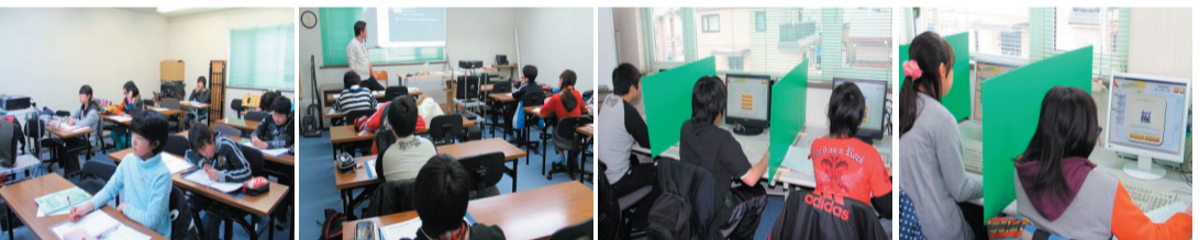
新中学1年生の春期講座（無料）に10名が参加してくれました。熱心なので1日追加して6日間になりました。