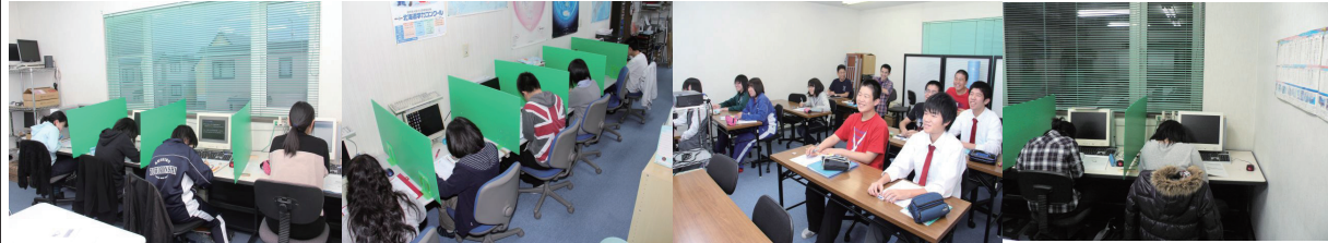
11/10～11日の定期テスト対策1000分特講 各学校のテスト範囲に合わせた問題を2日間徹底して解きます