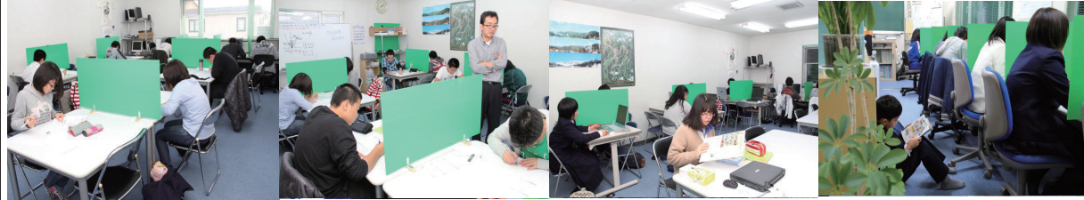
中3生の関数特講 11/17 土曜日に実施の特講は終わった順に帰るので必死