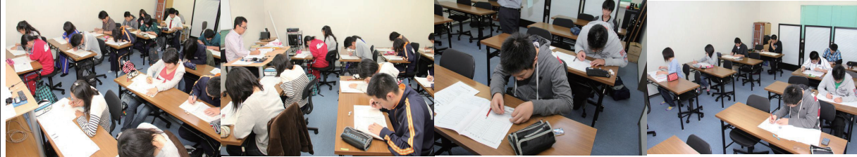
中学生の漢字検定受検の様子