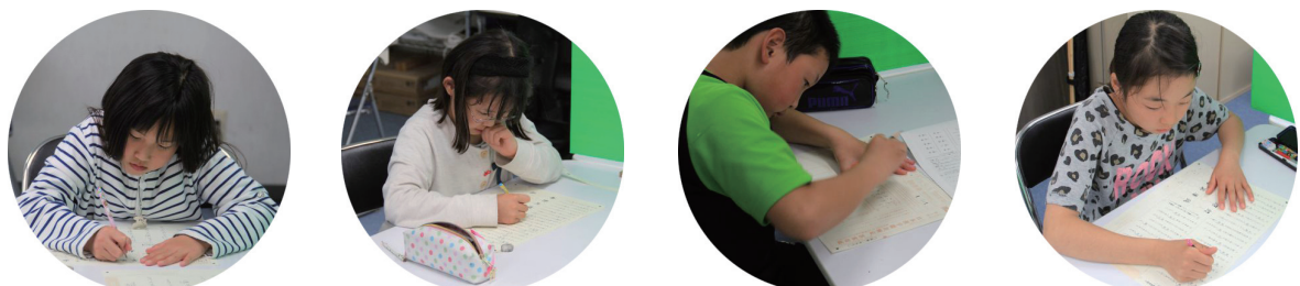
6/20 第1回の漢字検定を実施しました。およそ1ヶ月、漢検に備えて勉強しました。予想では7割の人が合格かな？

『もうすぐ夏期講座！』 毎年この時期、期末テストも終わり、中体連・高体連がひと段落、高校生は学校祭の準備をして夏休みへと。なんとなく気が緩み、7月は勉強に集中できない生徒が増えます。来年の高校入試の3月までおよそ36週です。センター試験の1月17・18日までは残り29週です。一週間はあつという間に過ぎていきます。 中1生は最初のテストの結果をふまえて、しっかり復習することが大切です。また、中3生は9、10、11月の学力ABCへ向けて、しっかりと基礎学力の確認をする必要があります。もちろん志望校が曖昧では成績は伸びません。 高校生は学校祭の準備など文化祭関連が続きます。この期間、どうしても勉強に身が入らず塾に来る回数も減ります。きちんと学習計画を立て、模試の結果をふまえて、志望校に向けた勉強をすることです。学習量の差が学力の差になり、その学力の差が社会人となったときの大きな差に繋がります。中学生も高校生も、夏休みがとても重要なことを忘れないで下さい。