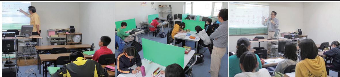
6/14,15 第1回の1000分特講 2日間でおよそ17時間ががんばってテスト範囲の勉強をしました。結果が楽しみです！