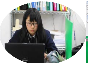
釧路の高校生は入試が終わると勉強しません。大学入試が大きく変わります。今やらなければ必ず後悔することになります！