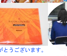
沢山の差入やお土産ありがとうございます。