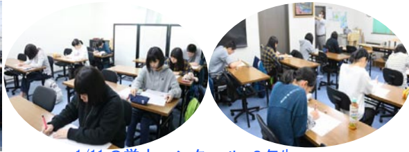
1/11の学力コンクール 3年生