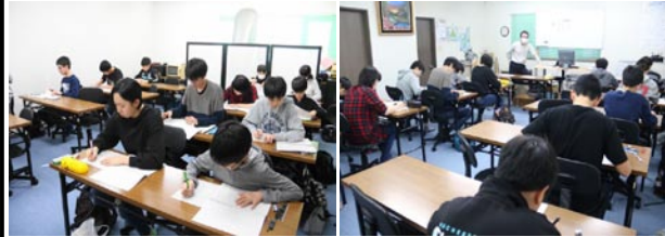
1/10の北海道学力コンクール 1,2年生