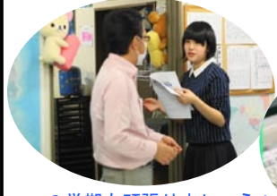
3学期も頑張りました！