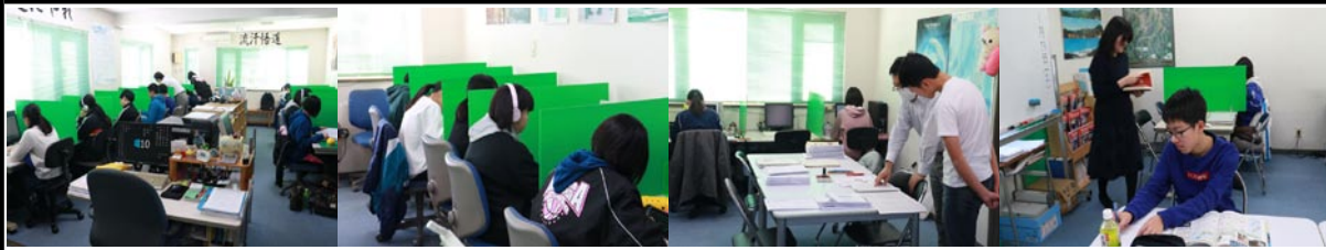
12/23 ~ 1/15 までの冬期講座