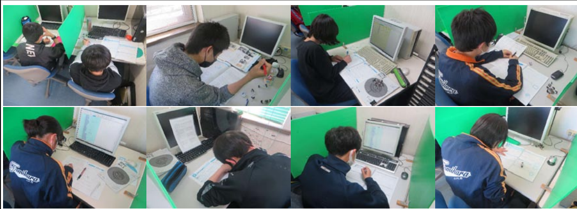
定期テストに向けての取り組む中学生（上2段） 第1回の漢字検定に向けて（下段）