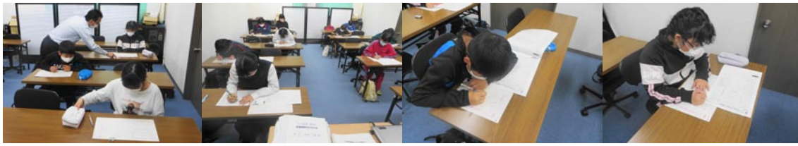
7/2 漢字検定の実施(上) 自己採点(下)