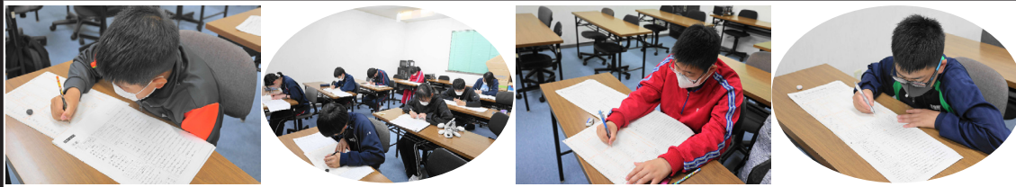
◆ 7月8日の漢字検定 自己採点では全員が合格のようですが・・・