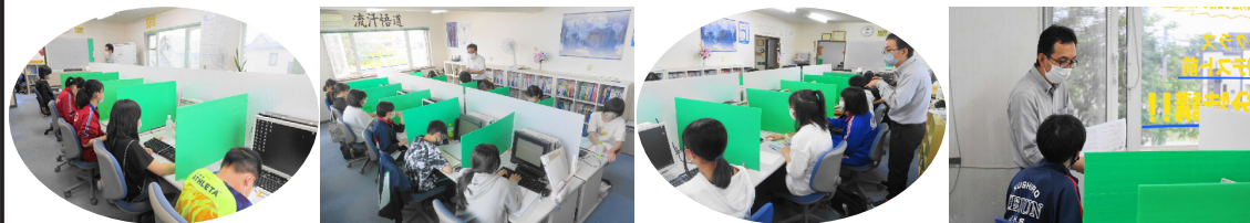
◆ 7月23日から夏期講座がスタートしました 中1、中2生は3時間、中3生は4時間です

2022年度全国学力・学習状況調査の結果 道内公立校の平均正答率は小6、中3の理科と中3の国語で全国平均と同水準だった一方、小6の国語、算数、中3の数学が下回った。このうち中3の数学は21年度の前回調査より差が開いた。道教委が、独自に集計して公表した道内の平均正答率を全国と比べると、小中の全6教科で全国を下回った。記述式問題の正答率は全国を下回り、全6教科で道内は正答率の少ない「下位層」も全国より多かった。小中とも国語は「書くこと」に課題があり、算数・数学はデータ活用、理科は問題解決や探究的な力を見る設問でつまづきが見られた。 学習状況調査では、ゲームを1日4時間以上やるとの回答が小中学生のいずれも2割に達し、道内の子どもがゲームを楽しむ時間が依然、全国より長い実態が浮き彫りになった。 ゲームを平日に1時間以上する割合は、道内の小6で全国より5・3ポイント高い81・4%、中3で同3・1ポイント高い74・4%。特に4時間以上との回答は小6で同5・2ポイント高い22・4%、中