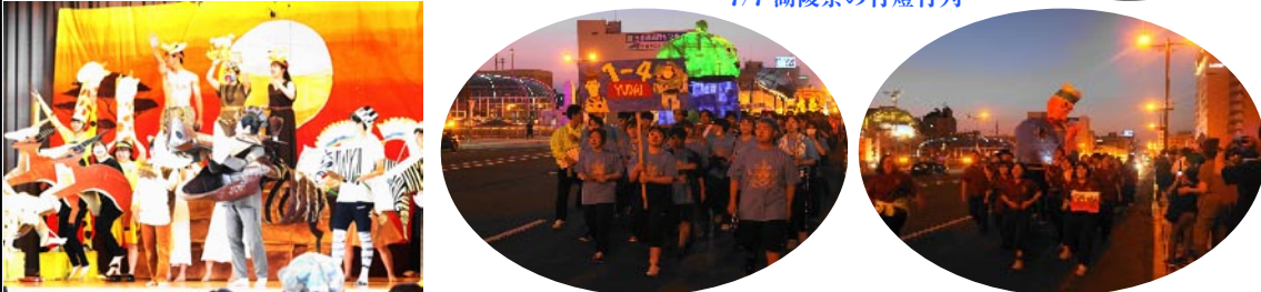
7/7 湖陵祭の行燈行列