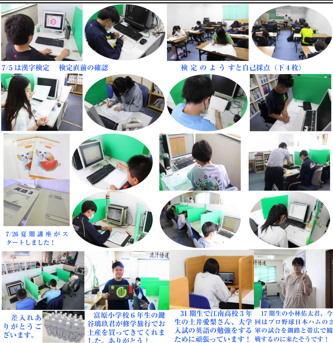
7/5は漢字検定 検定直前の確認